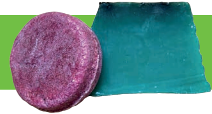
Festes Shampoo & Seife