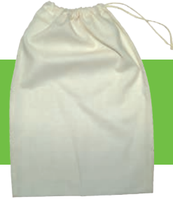
Obst- & Gemüsebeutel